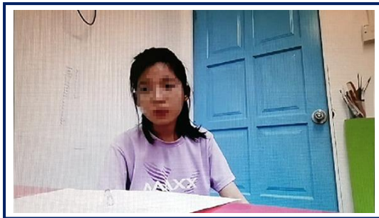
示意图：考生需在镜头中央